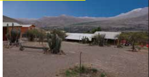
チリコースの観測予定地(イメージ)

2012年5月 金環日食チャータークルーズ他、2013年11月 ガボン金環皆既日食、2015年3月 ノルウェー海皆既日食チャーターフライト、2016年3月 インドネシア皆既日食、2017年8月 北米皆既日食