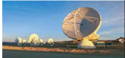
アルマ望遠鏡山頂施設を見学(イメージ)