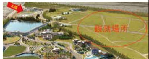
アルゼンチンコースの観測予定地(イメージ) ※観測場所は現在工事中のため、上記画像は完成予定図となります。(2019年7月完成予定)